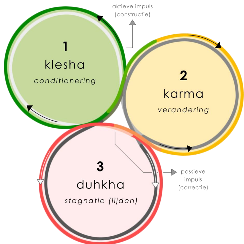
Figuur 2: De verdwazingslus (conditioneringscyclus): het drievoudig inzicht (trividya); zie ook noten 5 en 7.

De oorzaak voor deze aangedane staat is te vinden in de voorgaande fase, de tweede fase van verdwazing. Hierin werd ik bevangen door de talloze karmische materialen in me en om me heen. Als een zelf veroorzaakt en slechts ten dele bewust wezen ben ik gaan geloven dat oorzaken vrijelijk manipuleerbaar zijn, dat ik eigenaar ben van wat ik kan bemachtigen en dat ik soeverein beschik over alle maakbaarheid daarvan. Maar de beperkte en afhankelijke aard van ons zintuiglijke apparaat is helemaal niet in staat deze ongefundeerde, arrogante opstelling waar te maken: dagelijks vliegen ons de pijnlijke, destructieve gevolgen van die waan om de oren.